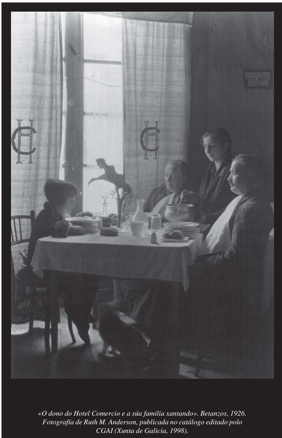
«O dono do Hotel Comercio e a súa familia xantando». Betanzos, 1926.