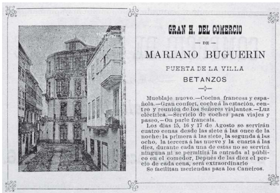
O «Hotel del Comercio» da Rúa Nova. Programa de Festas de S. Roque de 1903.

Por certo, na exposición e libro que a recolle apenas hai outras fotos de Betanzos, só unha da feira e a dun gaiteiro que non coñecemos. Claro que esta é unha pequena mostra dos varios miles de fotografías que a moza americana fixo en Galicia. É de supor que en Betanzos fixera algunhas máis.