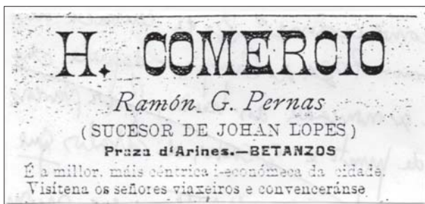
Publicidade do H. Comercio en Rexurdimento, 1922.