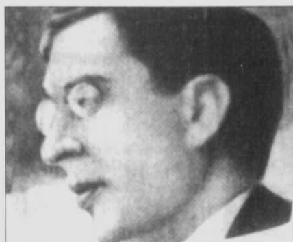
15.- Marcelino Domingo, do Partido Republicano Radical Socialista.