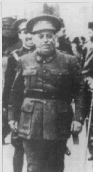
3.- O xeneral Sanjurjo.

«...sólo quedan los diputados radicales-socialistas que en su papel de hombres terribles y revolucionarios siguen pidiendo que se fusile a Sanjurjo o que dimitan los dos ministros del partido. No es concebible mayor necedad. Me dicen que la capitanea Galarza, subsecretario; no se le ocurre comenzar dimitiendo él mismo». 14