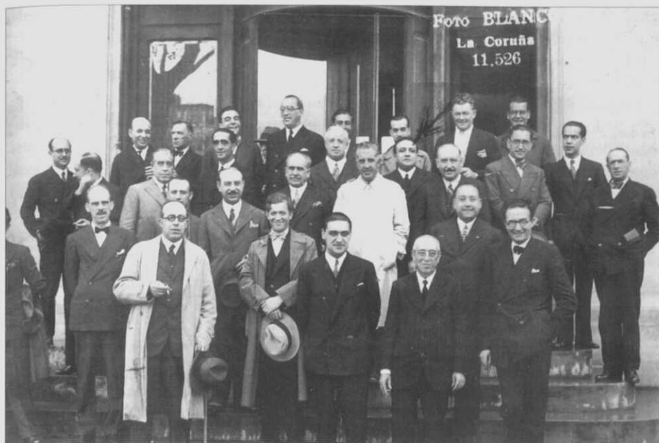
1.- Xuntanza convocada pola F. R. G. na Coruña, en xuño de 1931, para elaborar un proxecto de Estatuto.

disfrazadamente republicana, se había apoderado y sigue dueño de la provincia; los verdaderos republicanos venían sintiéndose sin amparo, ni ayuda de ningún género, al mismo tiempo que veían filtrarse a los enemigos del Régimen por todas partes y adueñarse de sus más seguros resortes. Todos estos graves síntomas obligaron a un grupo de hombres a pensar en la necesidad de obligar a una modificación total en la conducta que seguían los representantes del poder republicano. Cuando esta agrupación, al margen, repetimos de todos los partidos, republicana solamente, estaba a punto de recibir forma concreta los sucesos de Madrid y Sevilla confirmaron la seguridad de su propósito. Excusamos decir, con que éxito han acudido los republicanos auténticos, a formar no en un frente único que no debe existir sino en esta superación de los partidos cuyo más alto fin es que la República sea la república de todos, de todos los que no son sus enemigos más o menos disfrazados y de los que saben del valor de esta palabra.