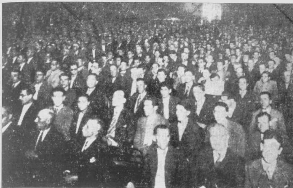
6.- Vista do público do mitin.