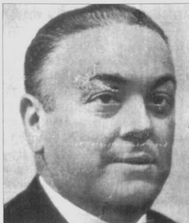
14.- Diego Martínez Barrio, presidente de Unión Republicana.